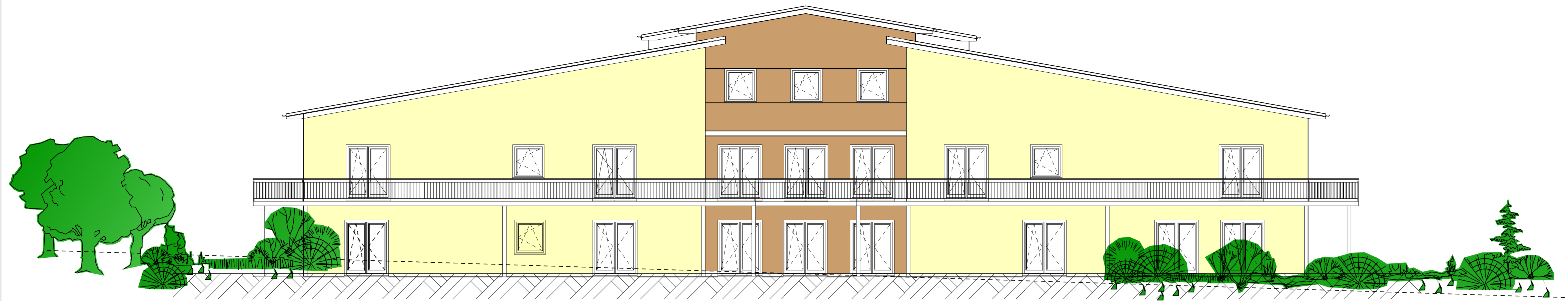
Gartenansicht - Südansicht